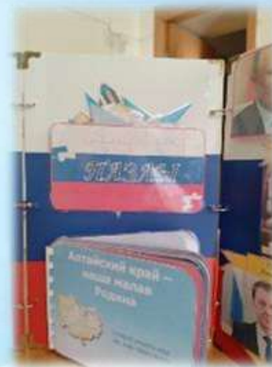
«Пазлы» «Алтайский край – наша малая Родина»