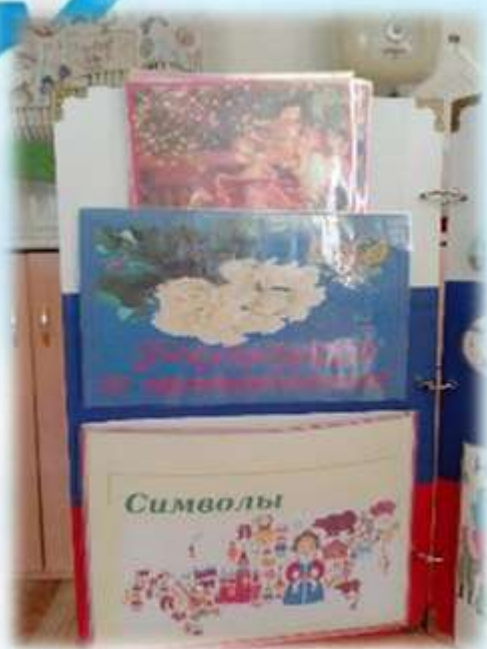
«Праздники России» «Символы»