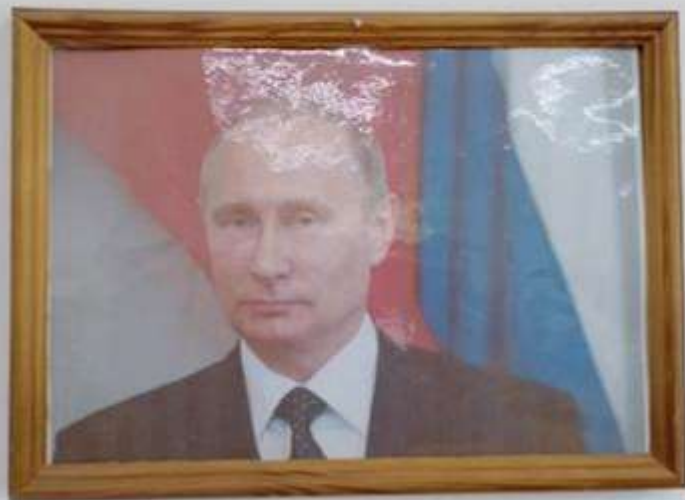
Фото или портрет президента России – размещается либо по центру уголка, либо слева.

Гимн – символ нашей страны, представляет собой музыкально-поэтическое произведение. Обычно представляется в виде текстового варианта и вывешивается на стенде, также должна быть музыкальная версия для прослушивания.