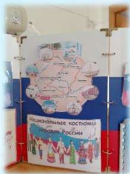
«Золотое кольцо России» «Национальные костюмы народов России»