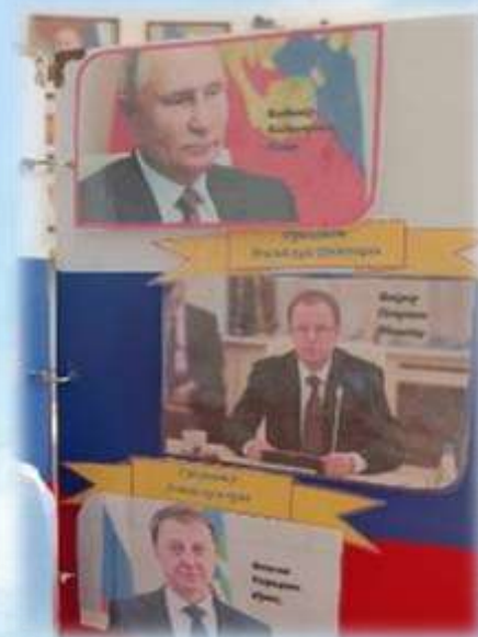
Президент РФ Губернатор Алтайского края Мэр г. Барнаула