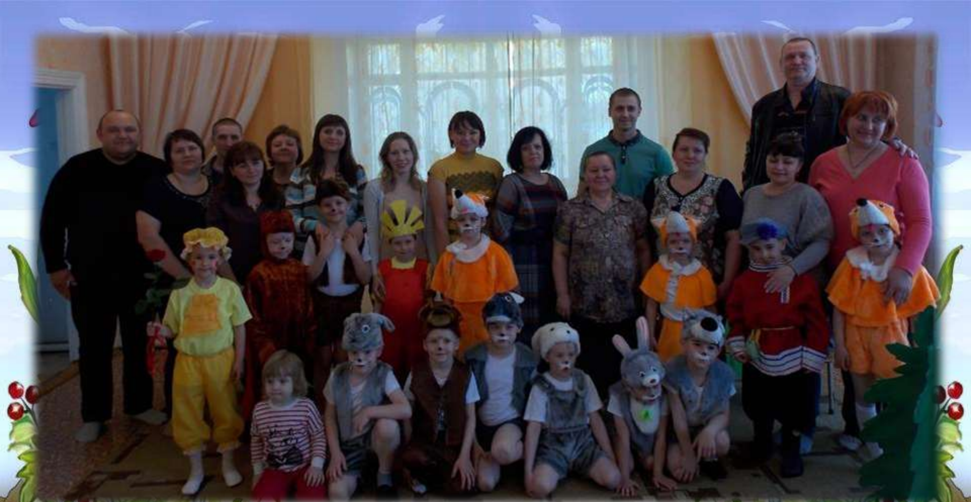
Артисты старшей группы и их родители