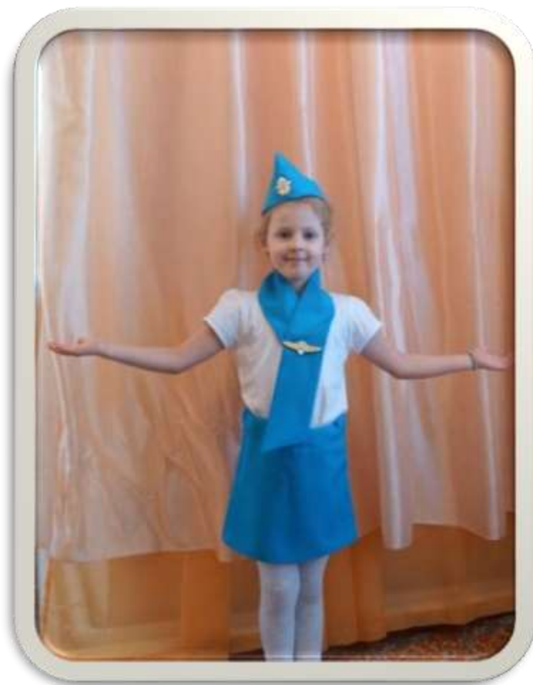
4. КАТЮША- СТЮАРДЕССА